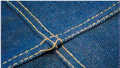
Fehlstiche – vor allem beim Übernähen von Quernähten

Fehlstiche und Nadelbruch werden häufig verursacht, wenn die Nadel beim Übernähen von Quernähten stark ausgelenkt wird. Die hohen Einstichkräfte, die beim Vernähen von mittelschweren und schweren Materialien (z. B. Jeans und Arbeitskleidung) auftreten, erhöhen das Risiko weiter.