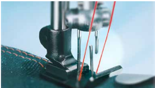
Nadelbruch – bei mangelnder Stabilität der Nadel